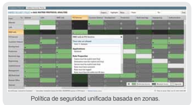
Política de seguridad unificada basada en zonas.

La Unified Security Policy™ de Tufin, es decir, la política de seguridad unificada, consigue que los equipos de seguridad de TI y redes tengan el poder para gestionar de forma efectiva la segmentación de red a través de una política de seguridad centralizada basada en zonas que se puede aplicar en toda la red y en todas las plataformas.