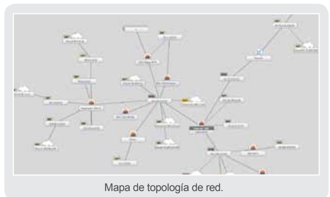
Mapa de topología de red.

El mapa de la topología de red de Tufin es compatible con todas las tecnologías habituales de los routers, como el enrutamiento estático y dinámico, VRF y MPLS, NAT, IPsec, balanceadores de carga y redes virtuales, entre otros. El mapa interactivo se actualiza automáticamente para visualizar y analizar la red, así como para exportarlo a formatos PDF, PNG o Visio.